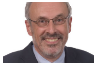
Rainer K. Silbereisen